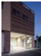
★アプローチ周り(夜景)★

変わりゆく街並みに新しく出来たこのビルが、今後どう馴染んでいくのか楽しみです。(藤田)