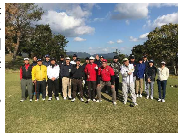
★(話とは関係ありませんが) 秋のゴルフ。気持ちよかったです★