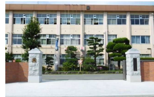
★創立100周年に向け改修された立派な正門です。(学校HPより)★