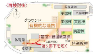
★↑現地を見た後の案