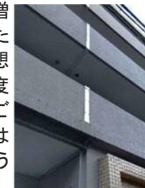
★増築時の接続…エクステンションジョイントを使用した建物★

…ということで、何やら半分設計者サイドの愚痴みたいになってしまいましたが、これらの要因でプランの変更、最悪構想が頓挫する可能性もあります。増築などで「こうしたい!」という構想がある方は一度設計事務所にご相談されてみてはいかがでしょうか。(松岡)