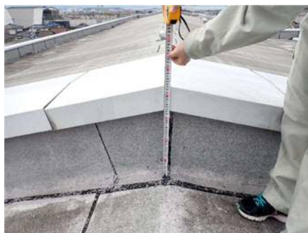
★現場調査の際の1枚★

ともに、学生の時との違いを感じたときには建築士としての一歩目を踏み出しているように感じ、充実感があります。業務を通して、仕様書を読み、法規や各部の詳細を確認し、設計図書や申請書類を作成するといった、設計の一通りの流れを経験しました。また、現地調査などを通して図面上での表現が実際の建物でどのような納まり、仕上がりになるのかを教えていただきました。学生の時よりも、実際に建物が建つことを