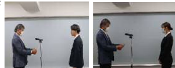
★内定証書授与の様子★

さて、弊社では、すでに来年度の新卒採用に向けて、準備の真っ只中でございます。弊社では、官公庁案件、民間案件、新築、増築、改築、改修、構造設計、耐震診断…と幅広く、意匠部と構造部がある設計事務所は珍しいと思いますし、たくさんの方が学べる環境だと思います。設計事務所での仕事にご興味のある方は、ぜひ弊社HPよりお問い合わせください。お待ちしております。(高野)