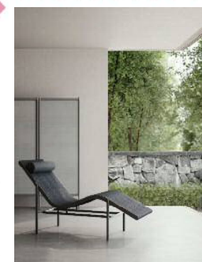
SAKYU 砂丘 99の植物性素材から、自然の肌触りを感じさせる 「砂丘」のデザイン。 Look into nature collection the earth nature series Created from the earth. Steel : W715 x D1665 x H900 x SH510 Wood : W745 x D1665 x H900 x SH510 Headrest : Upholstered Seat : Back : Fabric Frame : Steel / Wood Designed by Michael Geldmacher