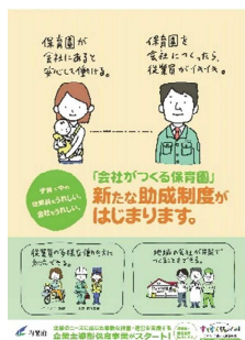
★企業主導型保育事業のチラシ★

以前、ニュースレターにて紹介させていただいた「企業主導型保育事業」の助成金の件ですが、多くの企業様から問い合わせをいただいております。今年の6月に始まったこの制度ですが、概ね2ヶ月おきに公募を行っており、11月の公募で3回目となります。11月の公募では、ある事業者様の整備費の申し込みのお手伝いをさせていただきました。また、前回紹介させていただいた、ファー