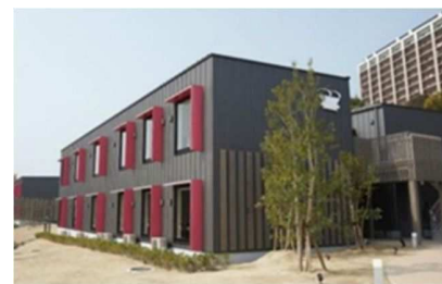
★CLT活用のハウステンボス「変なホテル」★

す。強度が高く、重量が軽いので、鉄筋コンクリート造や鉄骨造の建物の床や壁に採用することで、軽量化による耐震性能の向上が期待できます。また、CLTを見せるデザインにすることで、木質感を活かした空間を演出できることが魅力です。