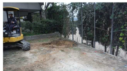
★地盤改良も行い安全・安心な建物へ★

公募までに何度も打合せを行い、園児や先生、保護者の動きなどを確認し、部屋の配置や大きさを決め