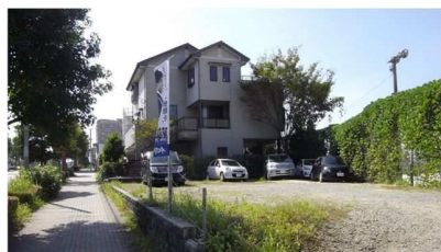
★席田小の隣で大通りに面した好立地★

私は現在、大井保育園さんからのご依頼で、木造平屋建ての小規模保育園の設計監理を担当しています。ご依頼内容は0～2歳を対象とした定員15名の小規模保育園を平成29年4月に開園したいというものでした。福岡市の公募に平成28年8月に応募し、同年10月に内定、翌年4月に開園という流れを目指し、その審査の一つとなる保育園の計画をまずはお手伝いしました。