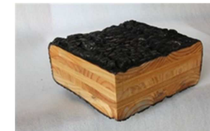
★断面を大きくして燃え残りを確保★

海外では1990年台から普及が始まっていましたが、日本では2016年4月から告示に基づく構造設計が可能になり、徐々に全国で採用が増えているところでは