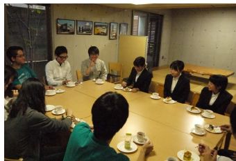
★内定式後に、社内で 若手社員だけでお茶しました★

さて、弊社では、新卒採用を継続的に行い続けて、8年目になります。今年も3月の採用活動開始に向けて、ただいま、準備の真っ只中です！また、2月までは随時インターシップの受け入れを行っております。弊社では官公庁案件、民間案件、そして新築、増築、改築、改修、構造設計、耐震診断と仕事の幅が広く、たくさんの方が学べる環境だと思います。設計事務所の仕事にご興味のある方は、ぜひ弊社ホームページから、もしくは直接下記までお問合せください。(澤田)