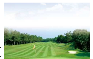
★ゴルフも巧くなりたい★

例年通り(?)、連日の忘年会で酔い気味の日々が続いていますが、それは想定内。今年は更に、行く先々やばったりお会いした電車の中でお声かけいただき、そのまま飲みに行くことも。今年の目標はズバリ、飲んでも疲れない体を手に入れる！です。