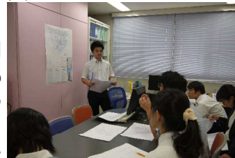
★インターン生のプレゼン★

今年も弊社ではインターンシップを実施しております。数年前より学業専念のために、就職活動期間の短縮が図られましたが、そのぶん、企業側も学生側もインターンシップに重点を置くようになってきています。あるデータによると、昨年は全体の約6割の学生さんがインターンシップに参加しているとのこと。1人の学生さんが数社まわることも、今や少なくないようです。