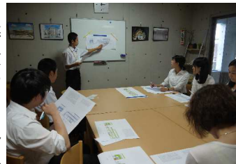
★中学生も来ていただきました★

さて、そんなインターンシップ事情ですので、弊社にも大学の夏休みの期間中は途切れなく、意匠・構造ともに学生さんに来ていただいております。正直、通常の業務もありますので、設計社員にはかなり頑張ってもらっているのですが、それでも、同じ設計を志す学生さんたちのお役に少しでも立てれば…と考えています。就職活動が始まる直前の2月まで随時受け付けております。学校の授業も考慮いたしますので、設計事務所での仕事にご興味のある方は、ぜひご連絡ください！(澤田)