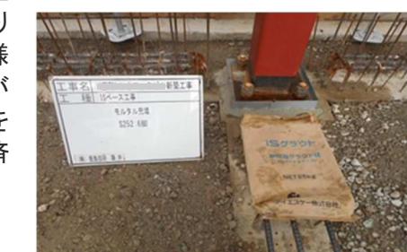
★モルタル充填状況★

施工の面でも柱脚工事は写真のように「アンカーセット」と「モルタル充填」の2工程あるのですが、柱脚工事の免許を持った専属の職人による施工で、施工精度が非常に高く、安心・安全を提供できます。”