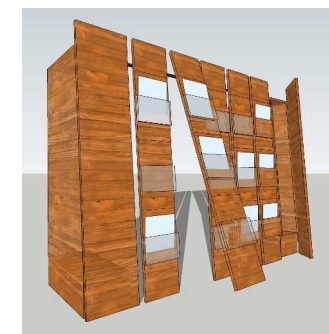
★リーフレット置き★

材の数を抑えれば、もちろんコストは減るのですが、その中で、機能を保ち、デザインも良くなければなりません。(世界遺産のメインゲートになることもあり、先方からもクールジャパンなデザインを希望されていました)