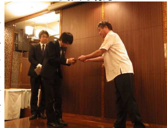
★社長より社員表彰★