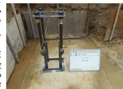
★アンカーセット状況★

設計自由度と経済性を重視した「柱脚ヒンジタイプ」の2つのタイプを取り揃えており、324通りの柱脚の仕様の中から建物に最も適した柱脚が選べるというところ。この工法を採用することにより、安全性と経済