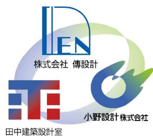
★傳設計グループ会社★

るよう従事する所存です。…とは申したものの、今回は新築ではなく改修です。改修工事ならではの隠れたところを開けてみないと分からないという予測の立たないトラブルが付きものです。一から線を引く設計とは違い、既存構造体や設備の状況をいかに正確につかむか、制限ある中でどう施主の要望や時代性にあった技術提案が出来るか、また、それら全てが法を遵守しているかが重要になります。そのためにも、これから本格的に進んでいく上で、傳設計グループとしての組織の強みと、多くのネットワークを生かし各分野に精通した方々の技術協力も借りて、来春には晴れてOPENの日を迎えることを楽しみに、取り組んで行きたいと思えます。(小野設計/藤田)