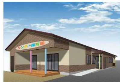
★色彩等を模索中の外観イメージ★

や侵入防止のため背の高い目隠しフェンスを設置するなど、さまざまな検討を行いました。また、厨房機器の検討や厨房を園児たちが覗ける窓の設置など、給食に対するこだわりについても、検討を行いました。