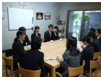
★内定式後の若手懇親会★

さて、もうすでに来年度入社の採用活動の準備も始めつつあります。近年、売り手市場となっている採用環境で、大手志向の学生さんが多く、その中で弊社は頑張っております。しかし、どんなご時世であっても、それぞれ学生さんが本当にやりたいことができる職に就いてほしい、せつかく建築を志して勉強してきているのだから、貫いてほしいと思います。弊社としても、“傳設計だからこそ”できることに共感してくれる学生さんと出会いたいです。“傳設計だからこそ”とは…説明会でたっぷりお話しいたしますので、ぜひHPよりお問合せをお待ちしております！(澤田)