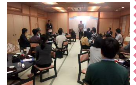
★協力会社様、鹿児島大学の先生方・学生さんをお招きしてお披露目パーティ★

◆鹿児島支店◆ 〒890-0054 鹿児島市荒田2丁目74番10号 ボヌール和楽102号室 TEL:099-813-8057 FAX:099-813-8058