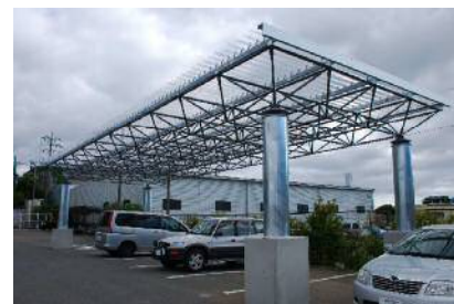
★九州第一工業さんのDI式スペーストラス工法(参考)★