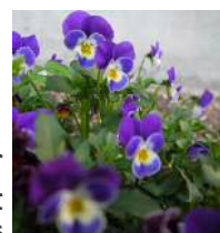
今年もきれいに咲いています

広報用の写真を二年に一度撮りに行っています。お店に入ると、「今年は“修正プラン”ですね」と言われ、ショックのまま撮影に臨むことに。無事に撮影を終えた後、店員さんから「修正は必要ありませんでしたね」のひと言。でしょ？500円返金してもらいました。