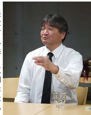
★今年長女が社会人になります★

最後になりましたが、皆さまのますますのご発展を祈念しますとともに、本年もなお一層のお引き立てを賜りますようお願い申し上げます。(岩本茂美)