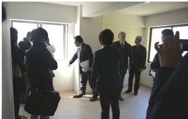
★以前開催したセミナーの様子★

近年の日本の建築は「スクラップアンドビルド」を繰り返すばかりではなく、リノベーションやリフォームで、不動産の価値を長く保とうという動きになってきました。前頁でもご紹介いたしましたが、現在、高美台保育園さんでは古い一軒家をリノベーションし、分園を創っています。この度、高美台保育園さんのご厚意で特別に現地見学セミナーを開催させていただけることになりました。保育園、リノベーションに興味がある方、見学のチャンスです。因みにリノベーションは機能