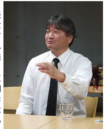
★今年は長女が社会人になります★

最後になりましたが、皆さまのますますのご発展を祈念しますとともに、本年もなお一層のお引き立てを賜りますようお願い申し上げます。(岩本茂美)